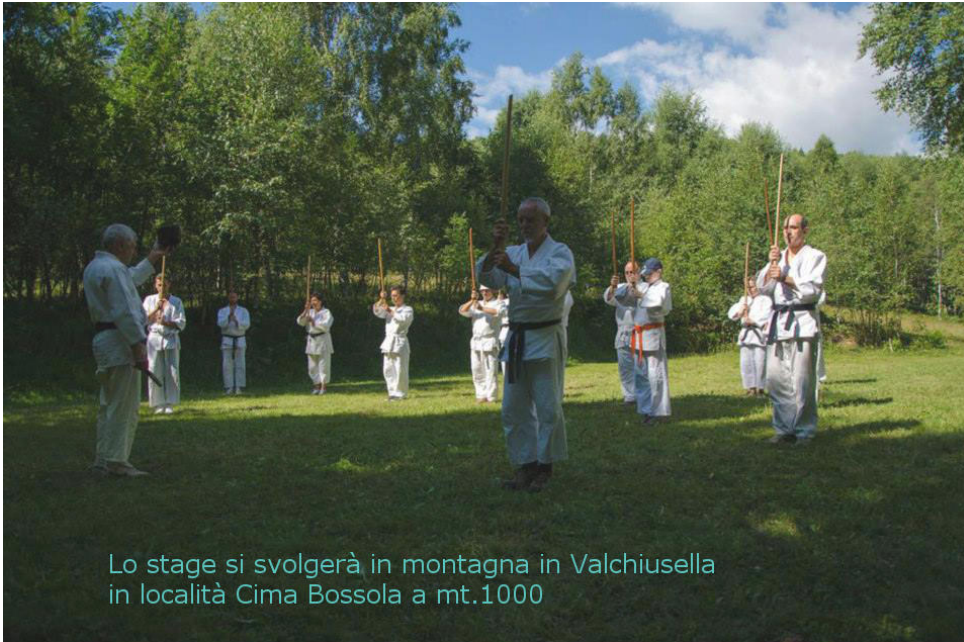
Lo stage si svolgerà in montagna in Valchiusella in località Cima Bossola a mt.1000

Lo stage si svolgerà in montagna per lo più all'aperto (istruzioni su come raggiungere la località dello stage le trovate sulla seconda pagina). Si può dormire sui tatami (al coperto) o fare campeggio libero in tenda E' necessario portare Jo Bokken e Tanto.