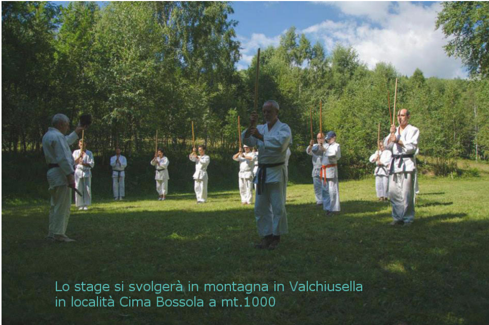
Lo stage si svolgerà in montagna in Valchiusella in località Cima Bossola a mt.1000

Lo stage si svolgerà in montagna per lo più all'aperto (istruzioni su come raggiungere la località dello stage le trovate sulla seconda pagina). Si può dormire sui tatami (al coperto) o fare campeggio libero in tenda E' necessario portare Jo Bokken e Tanto.